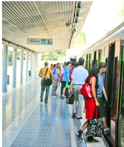
FGC: Estació Universitat Autònoma

Malgrat tot però, 30.000 llocs de treball i 15.000 nous residents generaran un gran nombre de desplaçaments en vehicle privat. La B30 actualment està molt saturada.