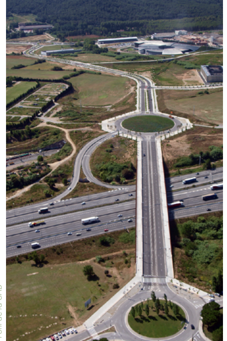
Pont de la UAB

És per això que la Generalitat va aprovar un Pla Especial Urbanístic d'Infraestructures pel Parc de l'Alba l'any 2016, la seva implantació resoldrà els problemes de congestió actuals i donarà solució a les necessitats del Parc sense esgotar la capacitat que tenen la B-30, l'AP-7 i la C-58.