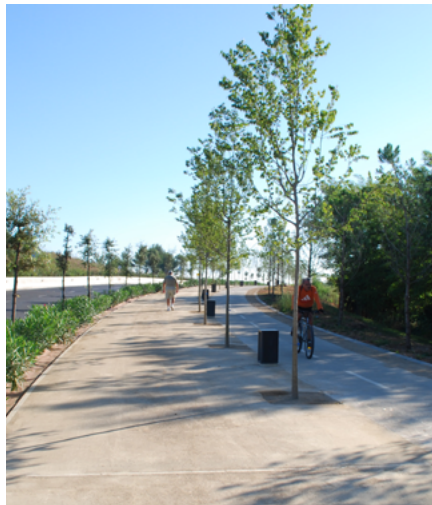
Voreres amples: BP- 1413

l'altres amb les estacions de RENFE i FGC.