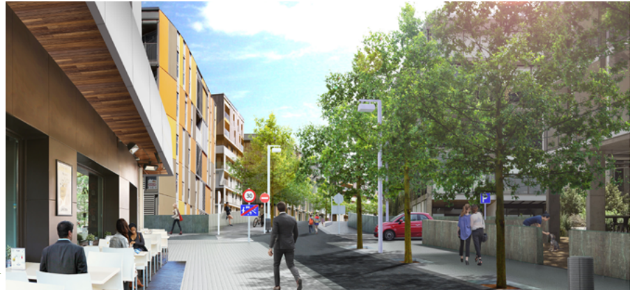
Proposta Barri residencial

La manca d'habitatge accessible és una realitat a l'àmbit metropolità, però també a Cerdanyola. El terme municipal és gran però la ciutat no té gaire espai per créixer. Això fa que la població en-